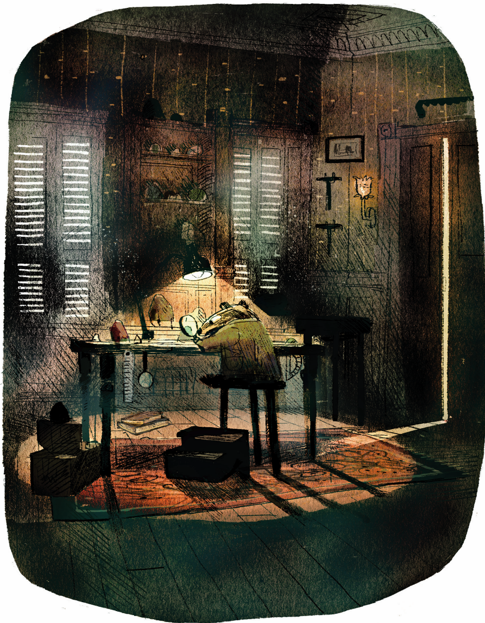
Rendkívül fontos közzétani kutatás